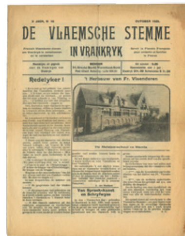
Maandelijks verscheen het krantje De Vlaamse Stemme in Vrankryk gericht aan de in Noord-Frankrijk verblijvende Vlamingen, oktober 1925. [ADV N, VY900000]

Een bestemming die tot recent veelal over het hoofd werd gezien, ondanks het kwantitatieve belang ervan, lag niet veraf maar had niettemin een grote impact op de betrokkenen: Wallonië en Noord-Frankrijk. Al in de eerste helft van de negentiende eeuw trokken kleine landbewerkers in de kalme wintermaanden naar de Waalse steenkoolbakkens, maar spoedig vonden ze ook hun weg naar de steenbakkerijen, chicorei-asten en bietenteelt in Noord-Frankrijk. Waar mogelijk, deed men aan pendelarbeid, maar niettemin woonden in 1880 zo'n half miljoen Belgen in