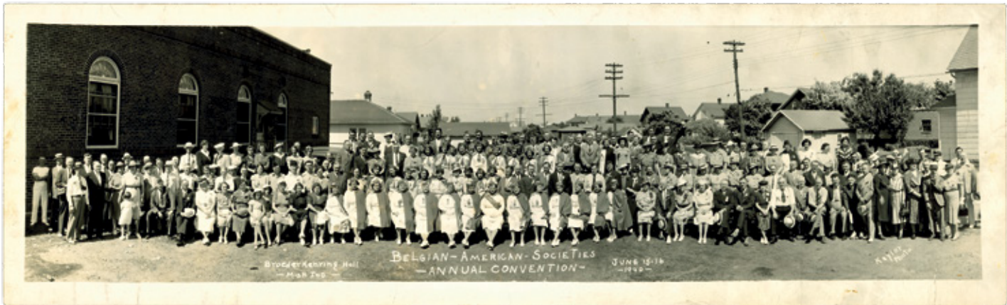
De jaarlijkse samenkomst van de Belgisch-Amerikaanse verenigingen, Mishawaka (Indiana-VS), 15-16 juni 1940. [ADV N, VFD236]

Frankrijk. Die arbeidsmigratie was ook sterk ten tijde van de crisis in de jaren 1930, en viel eigenlijk pas met de economische heropleving van Vlaanderen rond 1960 stil. De Vlaamse migranten hadden met menig vooroordeel af te rekenen. Onder meer om bij elkaar steun te vinden, bouwden ze een verenigingsleven uit, terwijl ook organisaties als het Willemsfonds en Davidsfonds zich over de uitwijkelingen bekommerden. Hoewel die instanties het Vlaamse stambewustzijn almaar sterker benadrukten, koos de meerderheid van de Vlaamse migranten voor integratie in de Waalse of Franse samenleving. Deze migratiestroom wordt onder andere gedocumenteerd in het archief van de Waalse afdeling van de IJzerstichting (BE ADVN AC519) dat de werking en activiteiten van de vereniging belicht, en in het archief Guido Stevens (BE ADVN AC75) dat onder meer vragenlijsten aan Vlaamse mijnwerkers in de Waalse steenkoolbakkens bevat. Het archief Hektor de Bruyne (BE ADVN AC111) bevat verslagen uit Frankrijk tijdens de Tweede Wereldoorlog.