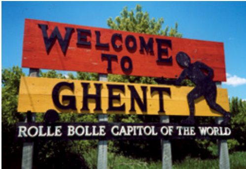
De stad Ghent (Minnesota-VS) waar krulbollen of rolle bolle behoort tot één van de nationale sporten, 2004.