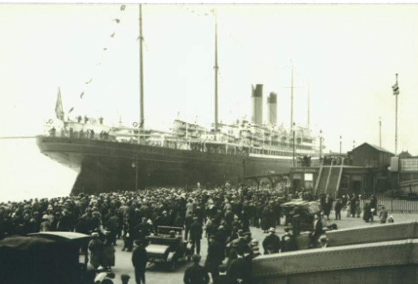
De Adriatic in de haven van Liverpool, 2 juni 1923. [ADV N, VPR1542]