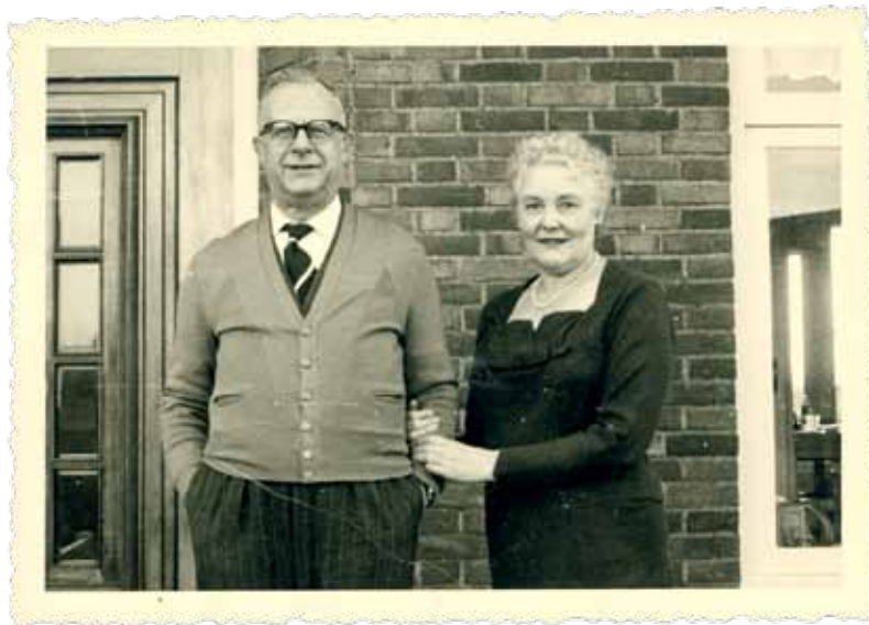
Hendrik Elias en zijn echtgenote Flora Moerman, jaren 1960.

Tijdens zijn gevangenschap hernam Elias zijn oude ambitie om een Ideengeschichte van de Zuidelijke Nederlanden te schrijven. Een eerste aanzet kwam er met het niet-gepubliceerde manuscript Geschiedenis van het nationaal gevoel in de Zuidelijke Nederlanden in 1947. Dit werk vormde de basis voor zijn magnum opus Geschiedenis van de Vlaamse Gedachte, 1780-1914 gepubliceerd tussen 1963 en 1965. In 1969 werd die publicatie gevolgd door Vijfentwintig jaar Vlaamse Beweging, 1914-1939 . Voor de Geschiedenis van de Vlaamse Gedachte werd Elias gelauwerd met onder meer de Prijs van de Vlaamse Provincies en de Frans Van Cauwelaert Prijs. De toekenning van beide prijzen ging gepaard met heel wat controverse, wat Elias uitgebreid