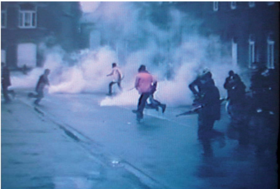
Still uit De Slag om Voeren.